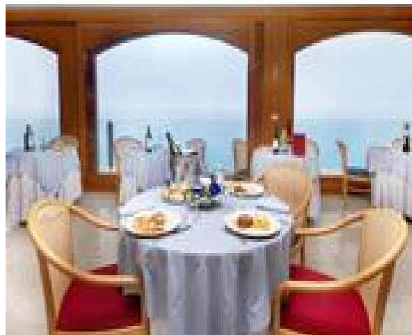
La sala da pranzo situata al 6° piano

Il trattamento è di pensione completa, comprende: