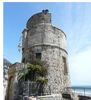
Il Torrione Saraceno