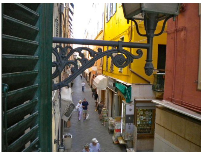
Il Budello e panorama